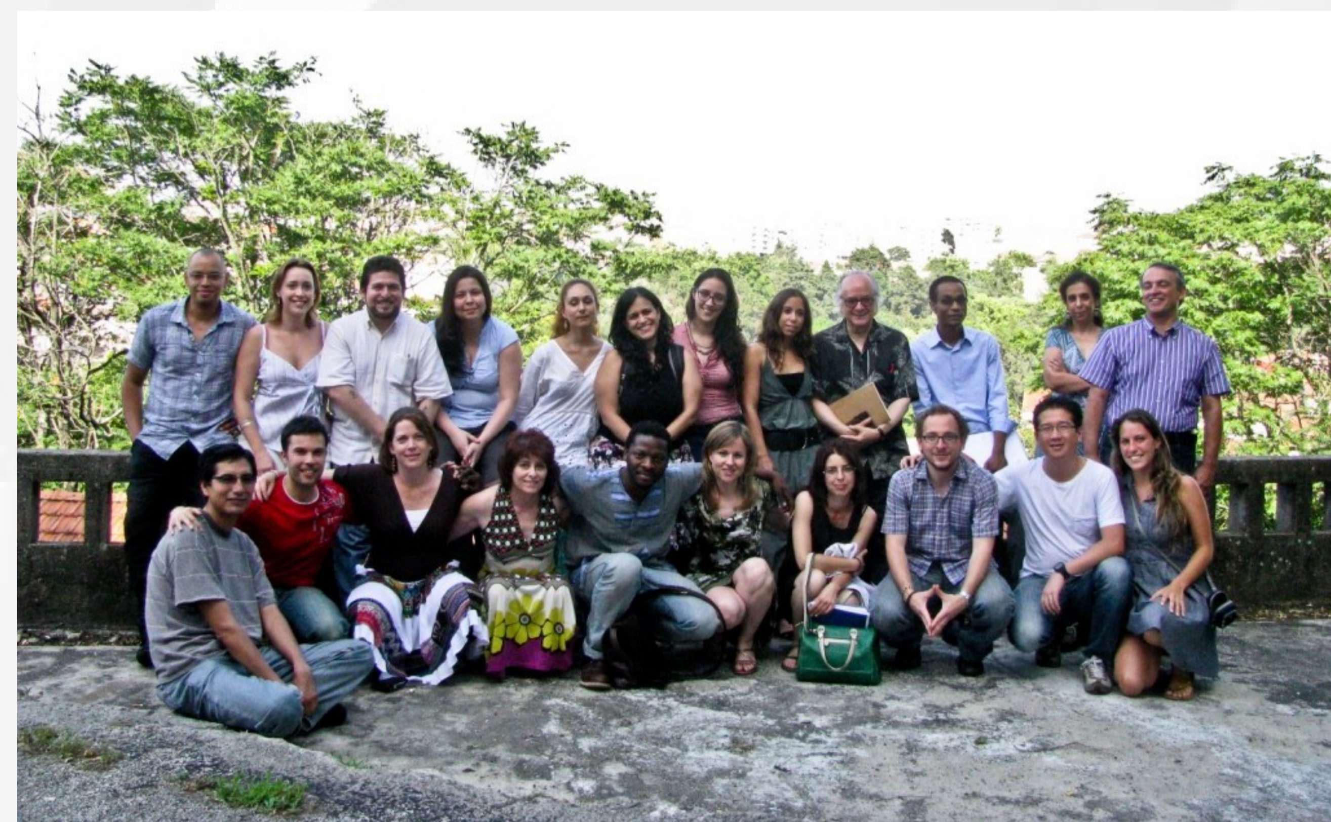
Equipa do Projeto

O Sul global, na sua imensa diversidade, assume-se hoje como um vasto campo de inovação económica, social, cultural e política. Trata-se, no entanto, de uma aposta exigente que pressupõe a disponibilidade para o conhecimento recíproco, a compreensão intercultural, a busca de convergências políticas e ideológicas, respeitando a identidade e celebrando a diversidade.